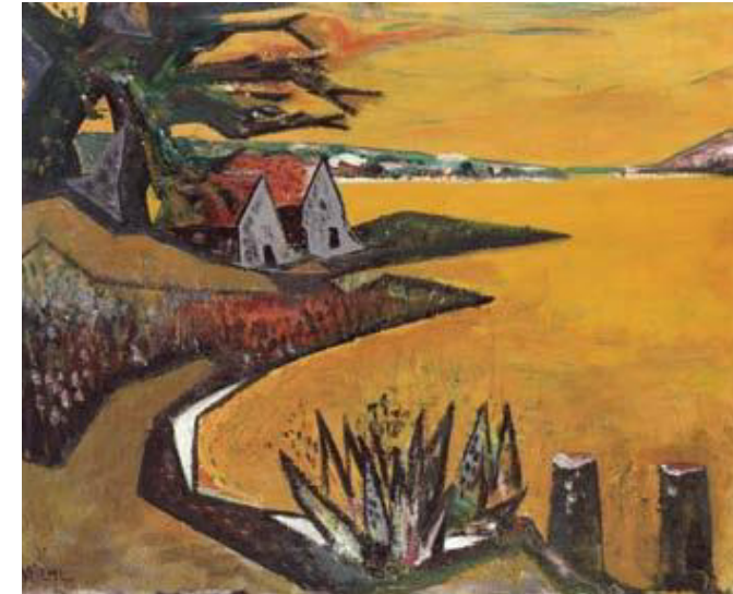
Haus Stern an einem sonnigen Tag, 1950er Jahre, Öl auf Malplatte, 60 x 73 cm