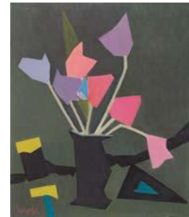
Tulpen in schwarzer Vase, 1950er Jahre, Öl auf Malplatte, 60 x 50 cm