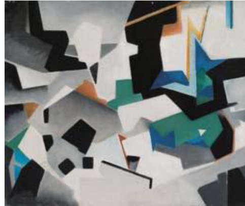
Komposition, Schwarzwald, 1950er Jahre, Öl auf Leinwand, 50 x 60 cm