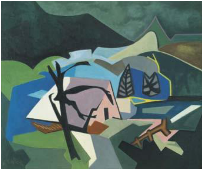
Schwarzwaldlandschaft mit kahlem Baum, Öl auf Malplatte, 60 x 80 cm

„Das Malen des Schwarzwaldes stellt den Maler vor ganz andere Aufgaben als der See. Dort unten haben wir helle leuchtende breite Flächen. Das Lichtspiel über dem See ist kein Beständiges, es wechselt häufig. Alle Dinge stehen weicher in der Luft. Bei uns oben im Schwarzwald herrschen herbe, schwere Töne. Die Atmosphäre hat nicht das weiche, das die Gegenstände verschwinden läßt. Es ist nicht leicht, den Gesamteindruck geschlossen zu binden, wie es die Atmosphäre über dem See erlaubt. Man steht vor der Gefahr, daß das Bild zerfällt, sich in einzelne Eindrücke auflöst, daher muß man die Töne straffer zusammenhalten.“ Hermann Wiehl, 1948