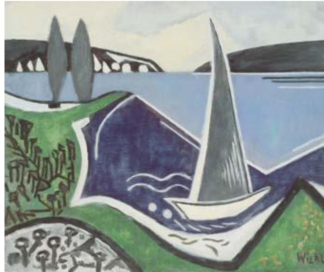
Segelboot am Untersee I, 1950er Jahre, Mischtechnik auf Malplatte, 50 x 60 cm

Vorderseite: Haus Stern, Hemmenhofen, 1950er Jahre, Öl auf Malplatte, 54 x 65 cm