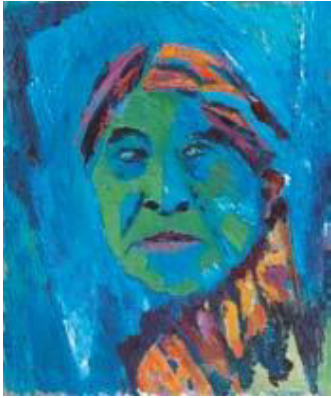
Selbstbildnis, 1950er Jahre, Öl auf Malplatte, 60 x 50 cm